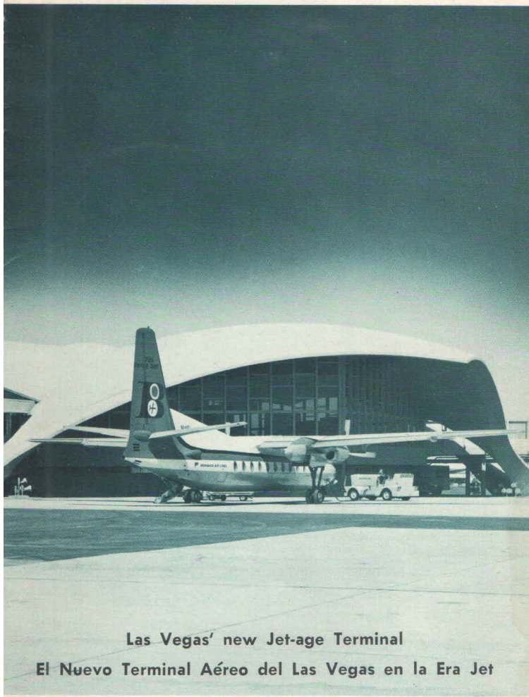
Las Vegas' new Jet-age Terminal El Nuevo Terminal Aéreo del Las Vegas en la Era Jet