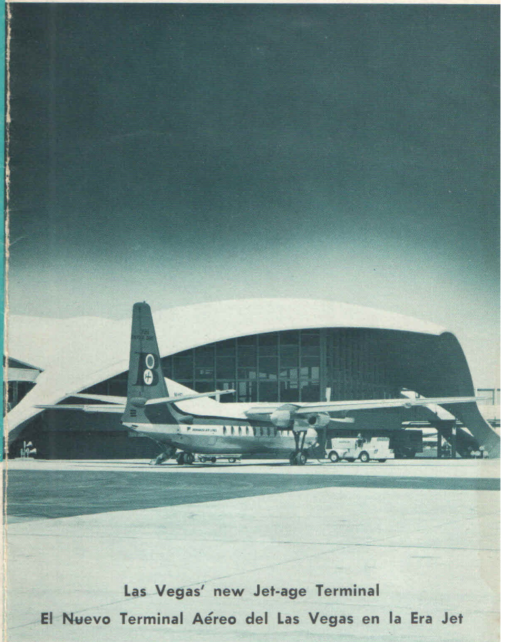
Las Vegas' new Jet-age Terminal El Nuevo Terminal Aéreo del Las Vegas en la Era Jet